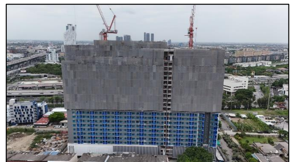
รูปที่ 1-3 สภาพโครงการปัจจุบัน