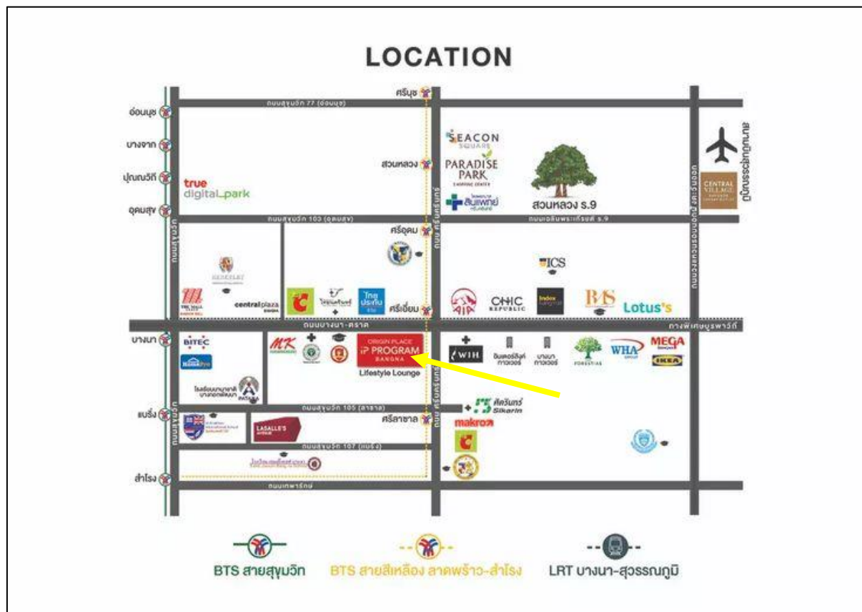
รูปที่ 1-1 แผนที่แสดงตำแหน่งที่ตั้งโครงการ